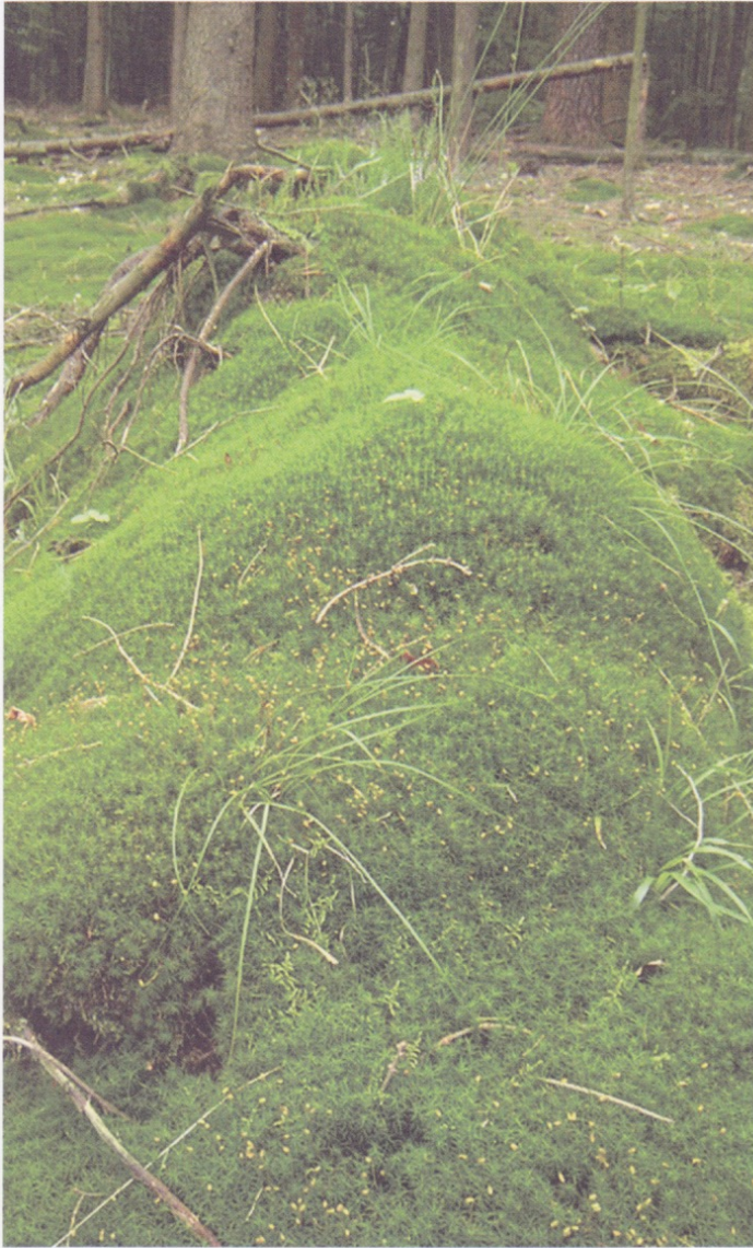
Nina Pettinato, «Quando sei nato, non puoi più nasconderti», Fotoserie / photo spread, 2005