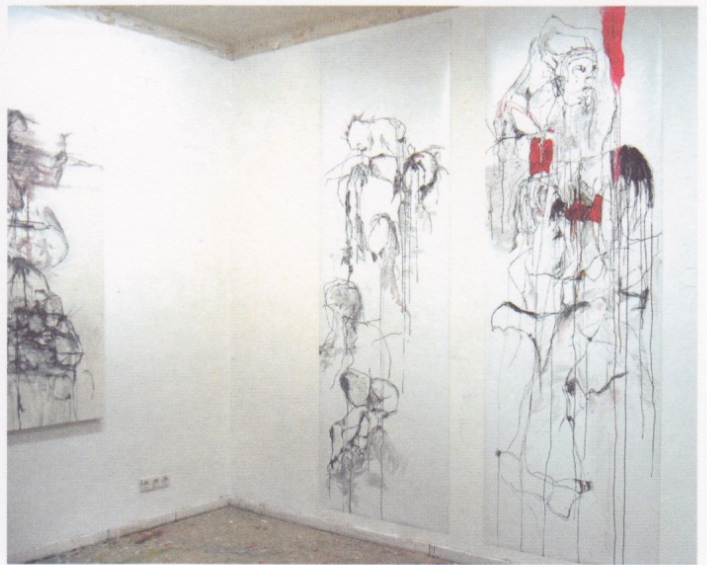
Oben / top: Marc Nothelfer; »Stages, No.2«, Rauminstallation / room installations, 2005; rechts / right: Oliver Flössel, »Schrilles Tor« / »Schrilles Tor«, Zeichnungen auf Leinwand / drawings on canvas, 2005